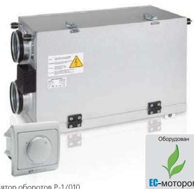
Регулятор оборотов P-1/010