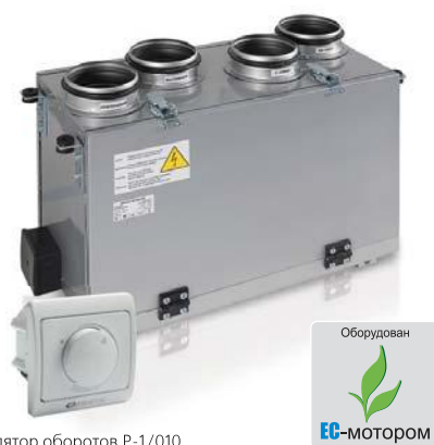
Регулятор оборотов P-1/010